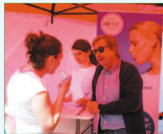
Opération de prévention à Arcachon

Les pharmaciens se mobilisent aussi et organisent ici et là des semaines de repérage de la BPCO. Ce fut le cas dans le Languedoc-Roussillon en 2010 où 82 officines ont répondu présentes pour effectuer des tests de mesure du souffle à la demande de leur Ordre. Plus récemment, des pharmaciens membres de groupements ont organisé des formations pour mieux dépister la BPCO. Une convention a également été signée en 2014 entre la Mutualité française et le réseau des officines pour une vaste opération de détection menée sur 15 territoires dans trois grandes régions (Nord, Bretagne et Rhône-Alpes) et dans 150 pharmacies. 825 mesures du souffle ont ainsi pu être réalisées auprès des adhérents des mutuelles partenaires de l'opération. Ces quelques exemples illustrent la volonté des professionnels de s'engager